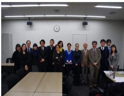
Tokyo, université de Waseda, l'équipe scientifique franco-japonaise