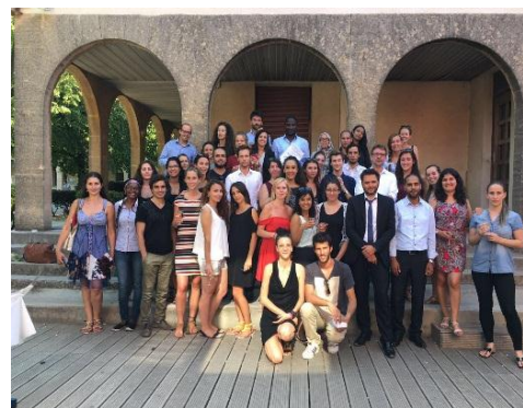
Les participants à l'Ecole d'été