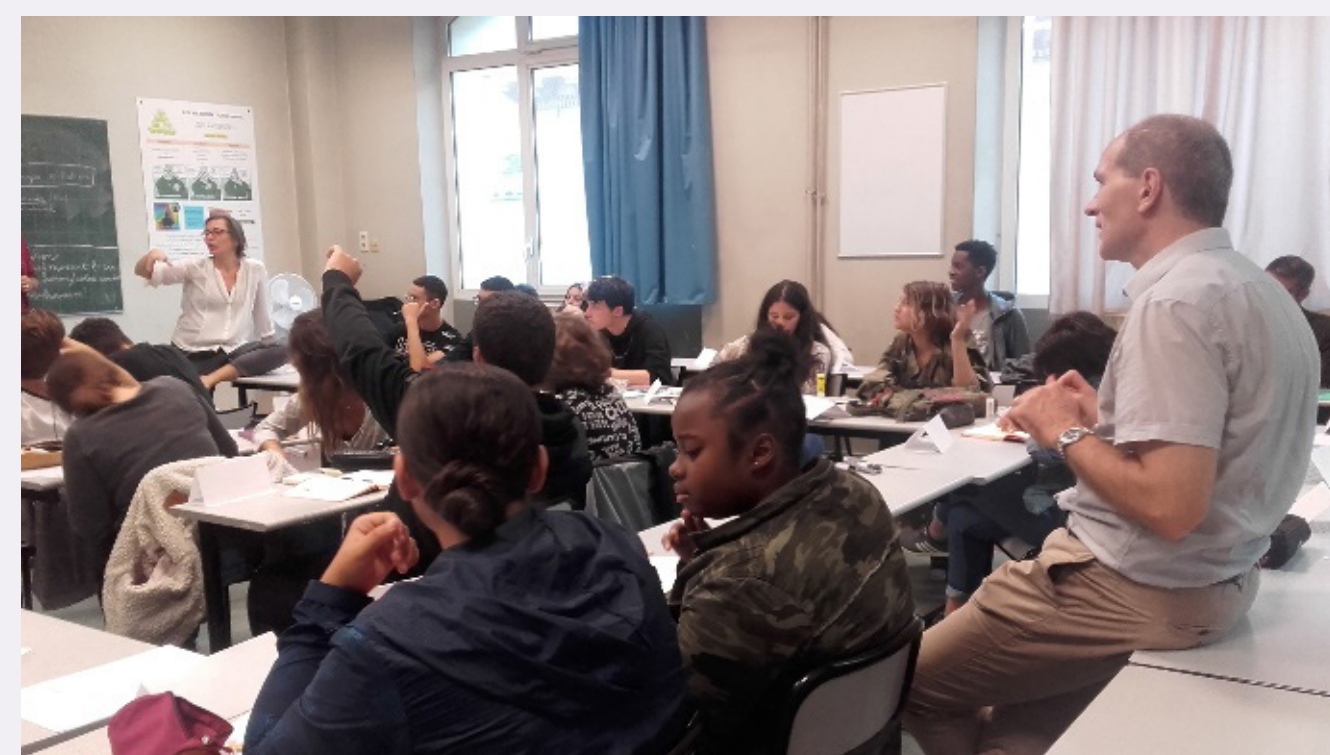
LYCEE D'ENSEIGNEMENT GENERAL ET TECHNOLOGIQUE MONTGRAND, MARSEILLE (6 e ) - classe de 2 ème