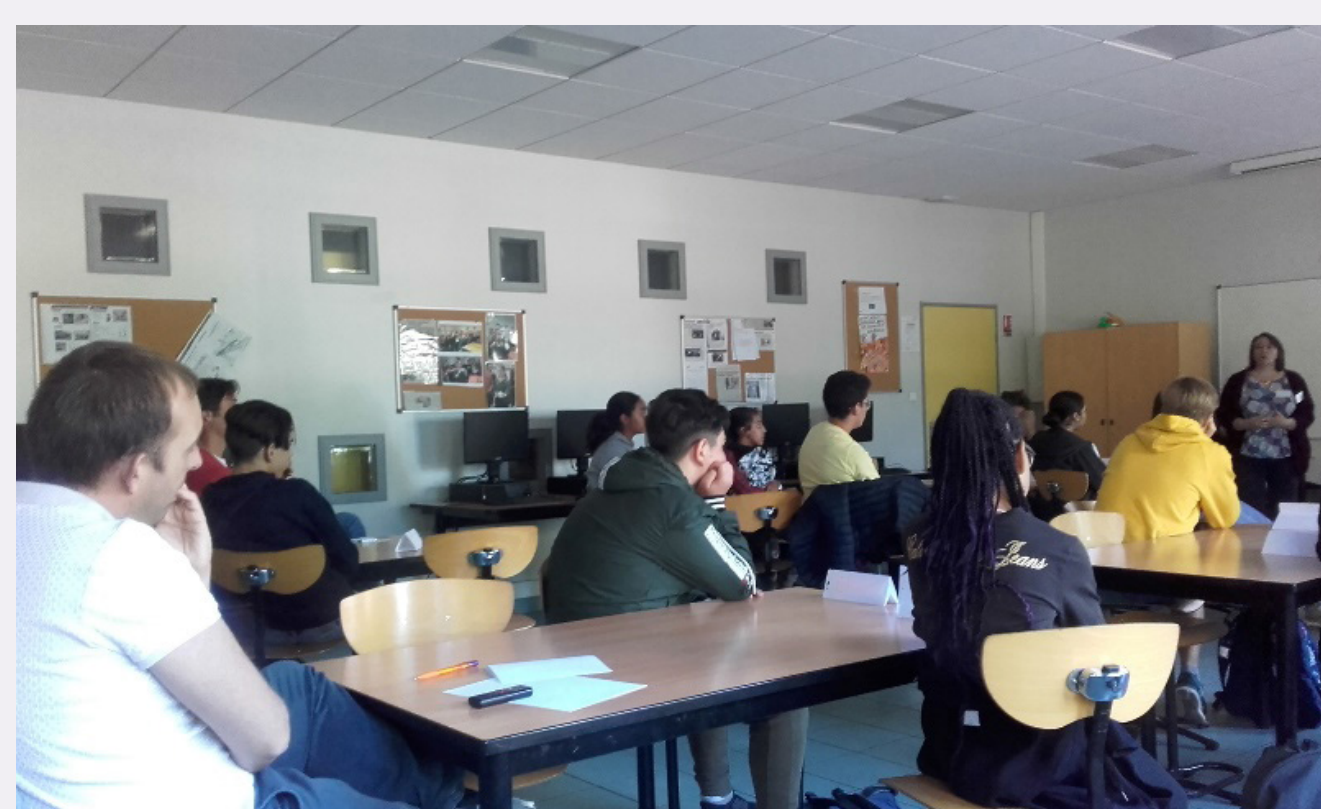
COLLEGE GÉNÉRAL PUBLIC JEAN BRUNET, AVIGNON classe de 3 e en éducation prioritaire