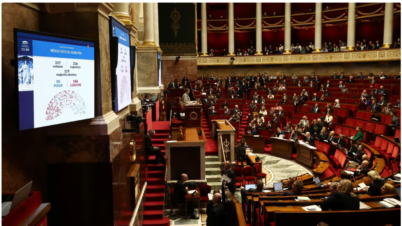
Les députés en séance à l'Assemblée nationale.

Publié le 10/06/24 à 17:30 - Mis à jour le 10/06/24 à 17:30